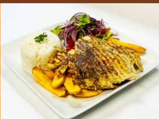
Pechuga de Pollo a la Parrilla