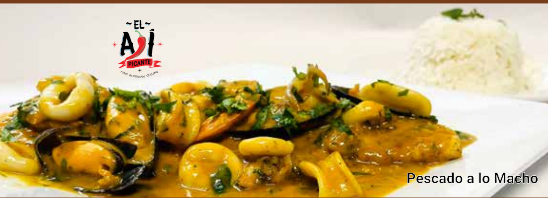
Pescado a lo Macho