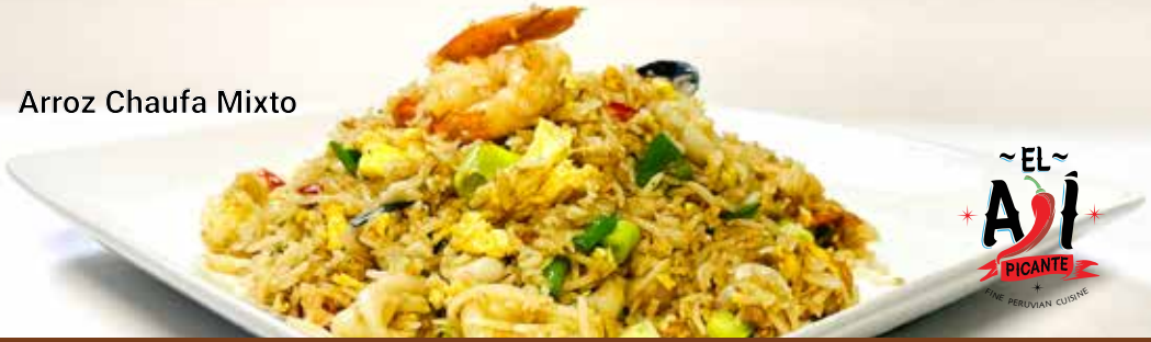
Arroz Chaufa Mixto