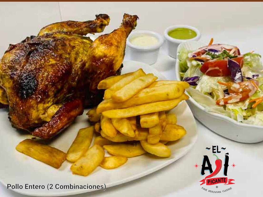
Pollo Entero (2 Combinaciones)

1 Pollo Entero (2 Comb)+ Inka Kola 2L $30.99 1 Pollo Entero (2 Comb) No Soda $28.99