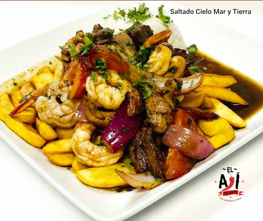
Saltado Cielo Mar y Tierra