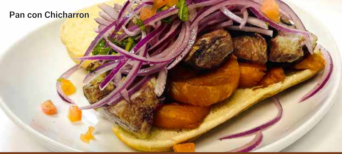
Pan con Chicharron