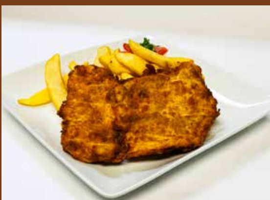
Milanesa de Pollo