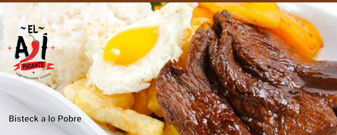
Bistec a lo Pobre