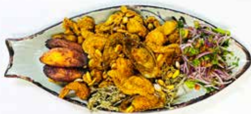
Jalea - Mixta